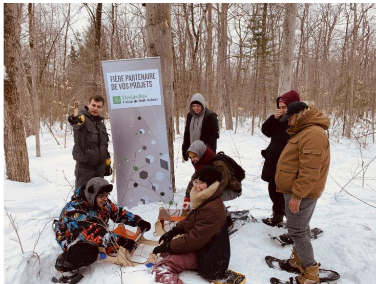
Tissage numérique sur neige au Parc de Gatineau

En vue de soutenir les initiatives visant l'innovation autochtone et le développement de l'économie numérique, la Caisse Desjardins de Hull-Aylmer a financé un projet intitulé Tissage numérique . Prévú pour l'hiver 2019, ce projet a été fait en deux volets : d'abord, les jeunes étudiants du FabLab Onaki ont fabriqué les machines à tisser numériques grâce à la découpe au laser; puis, des activités hivernales ont permis de mettre en valeur certaines traditions autochtones.