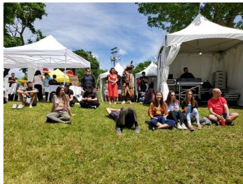
Journée nationale des Autochtones au Parc des Cèdres.

Le 21 juin 2019, le Centre d'Innovation des Premiers Peuples en partenariat avec la Ville de Gatineau, Outaouais en fête et Impératif Français a organisé la Journée nationale des Autochtones. La journée, célébrée au Parc des Cèdres, a été marquée par une expérience gastronomique signée Premiers Peuples, une exposition d'arts, les arts de la scène (Chants, danses traditionnelles, grand tambour, contes et légendes), un atelier linguistique : la langue algonquine, un regard sur l'histoire : un récit poignant sur l'histoire telle que vécue et interprétée par les Autochtones, un jeu-questionnaire sur les « Mythes et Réalités autochtones » et une présentation de documentaires poignants sur l'identité autochtone par le Wapikoni mobile. Plusieurs artistes de la région ont pris part à cet événement qui a été rendu possible grâce au généreux financement de Patrimoine Canada.